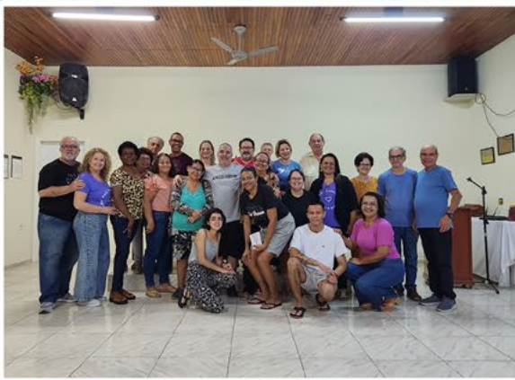
Reunião realizada em Colatina com Vices-Presidentes da FEEES e representantes das Casas Espíritas do 2º CRE