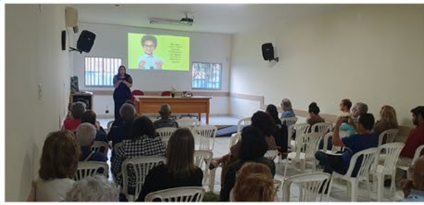
Capacitação da Área da Família